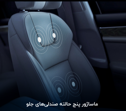
ماساژور پنج حالتہ صندلی‌های جلو