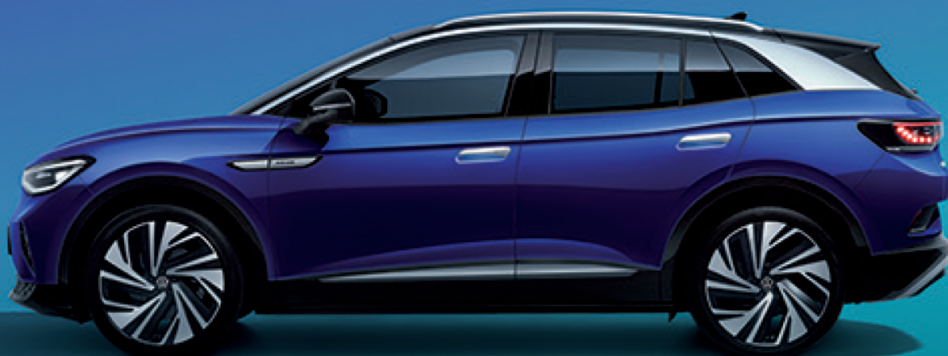
پلتفرم MEB فولکس واگن