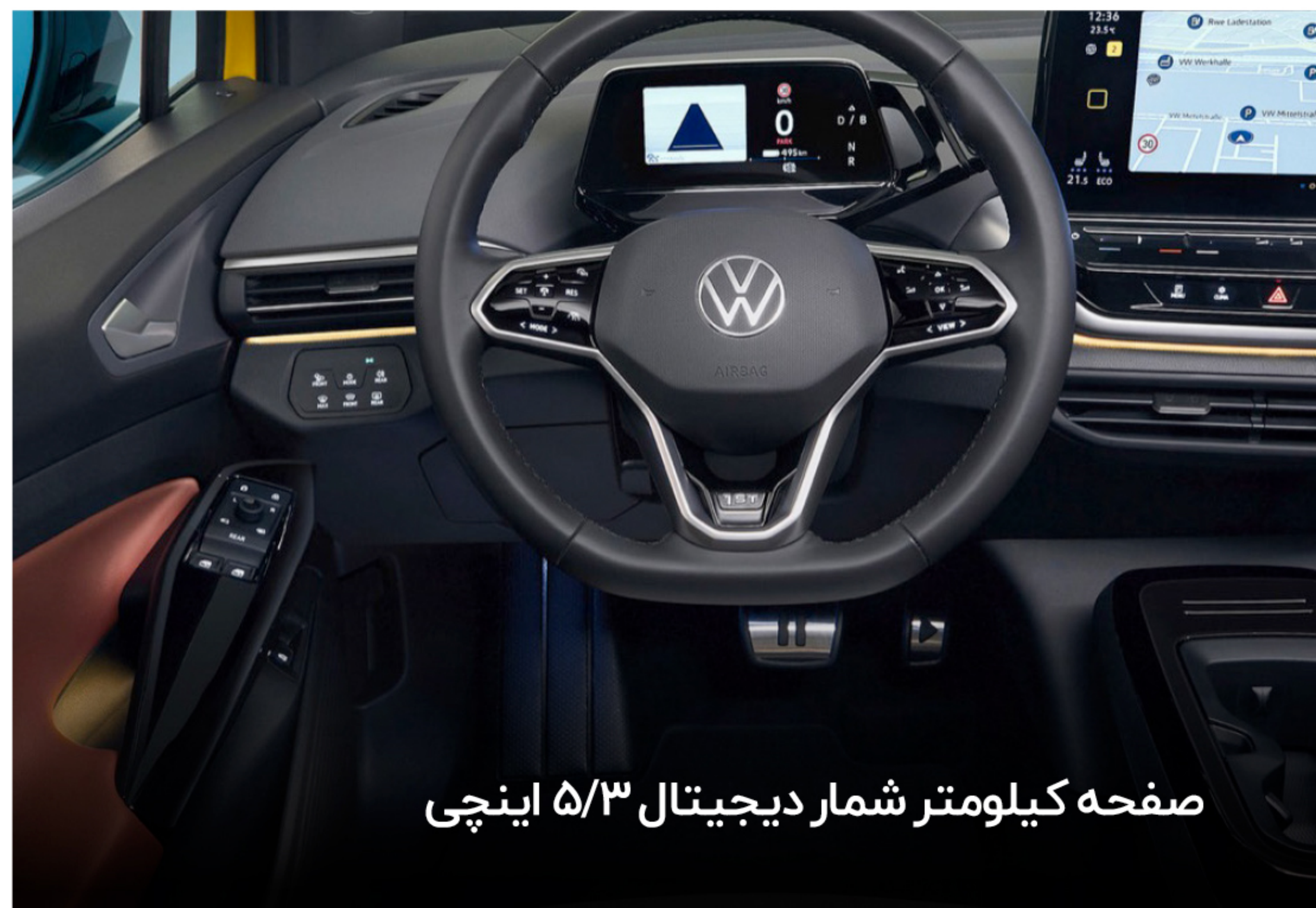
صفحه کیلومتر شمار دیجیتال ۵/۳ اینچی