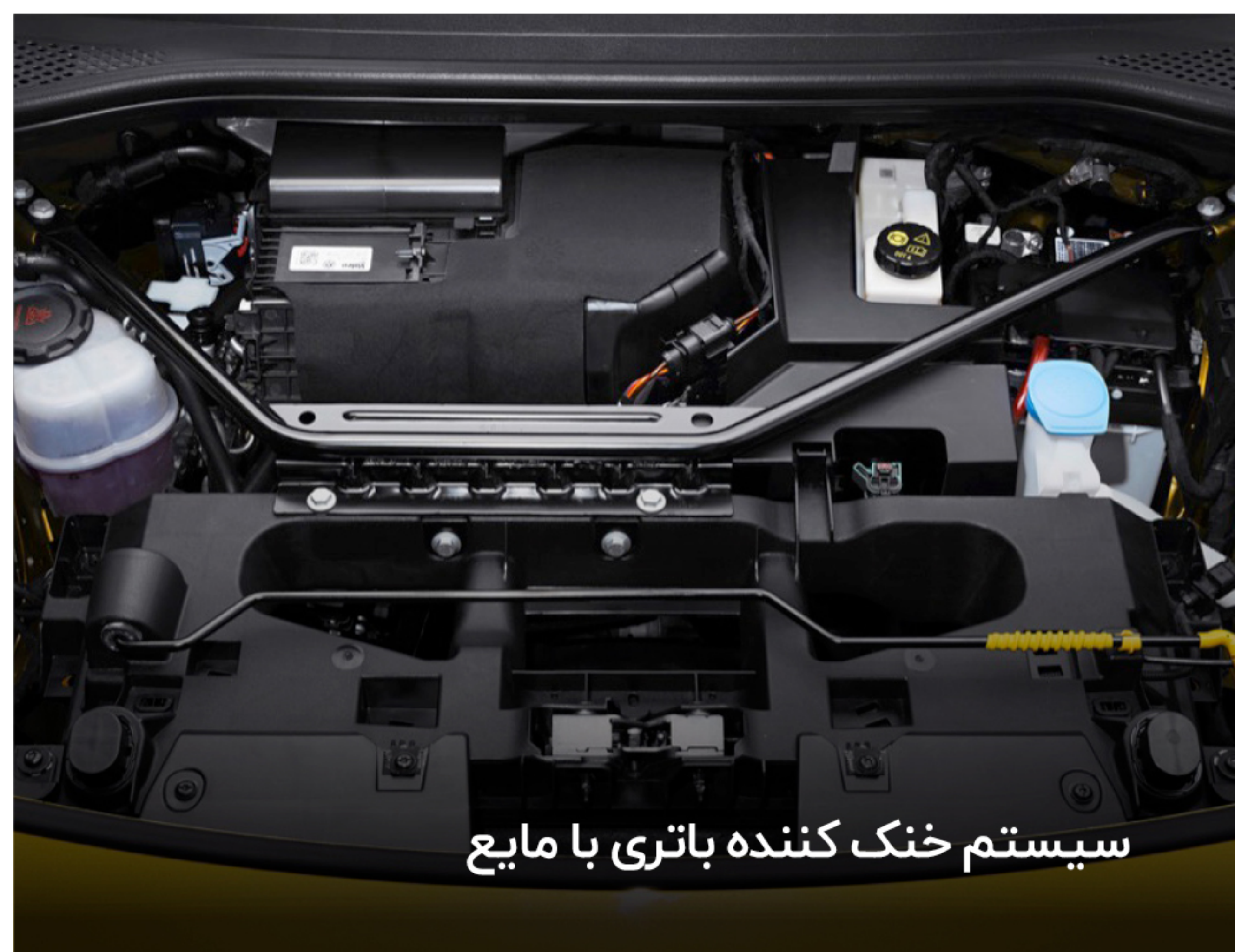
سیستم خنک کننده باتری با مایع