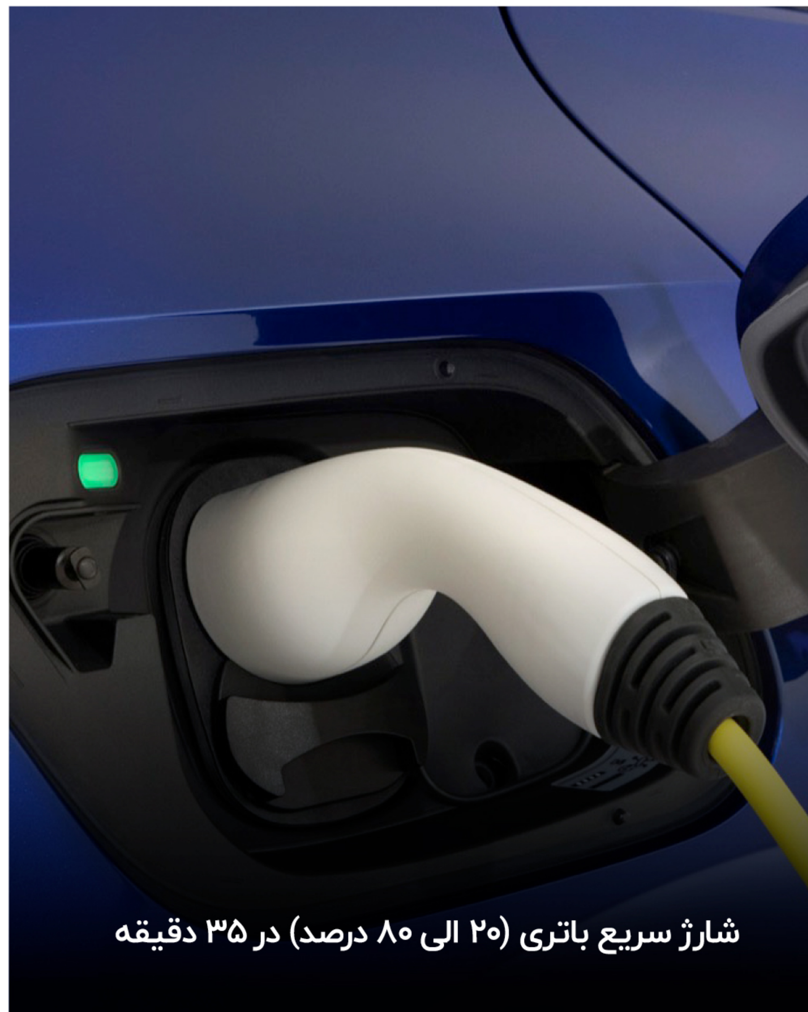
شارژ سریع باتری (۲۰ الی ۸۰ درصد) در ۳۵ دقیقه