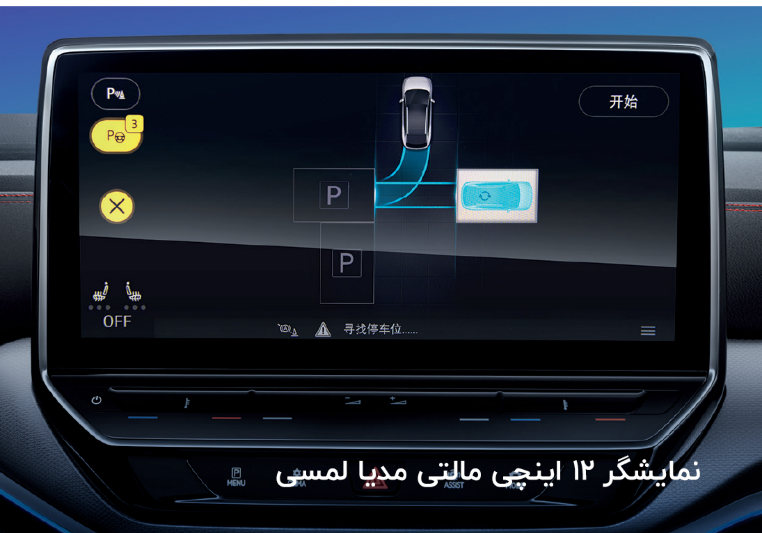
نمایشگر ۱۲ اینچی مالتی مدیا لمسی