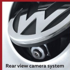
Rear view camera system