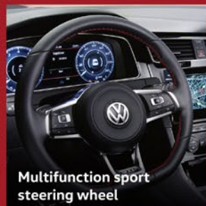
Multifunction sport steering wheel