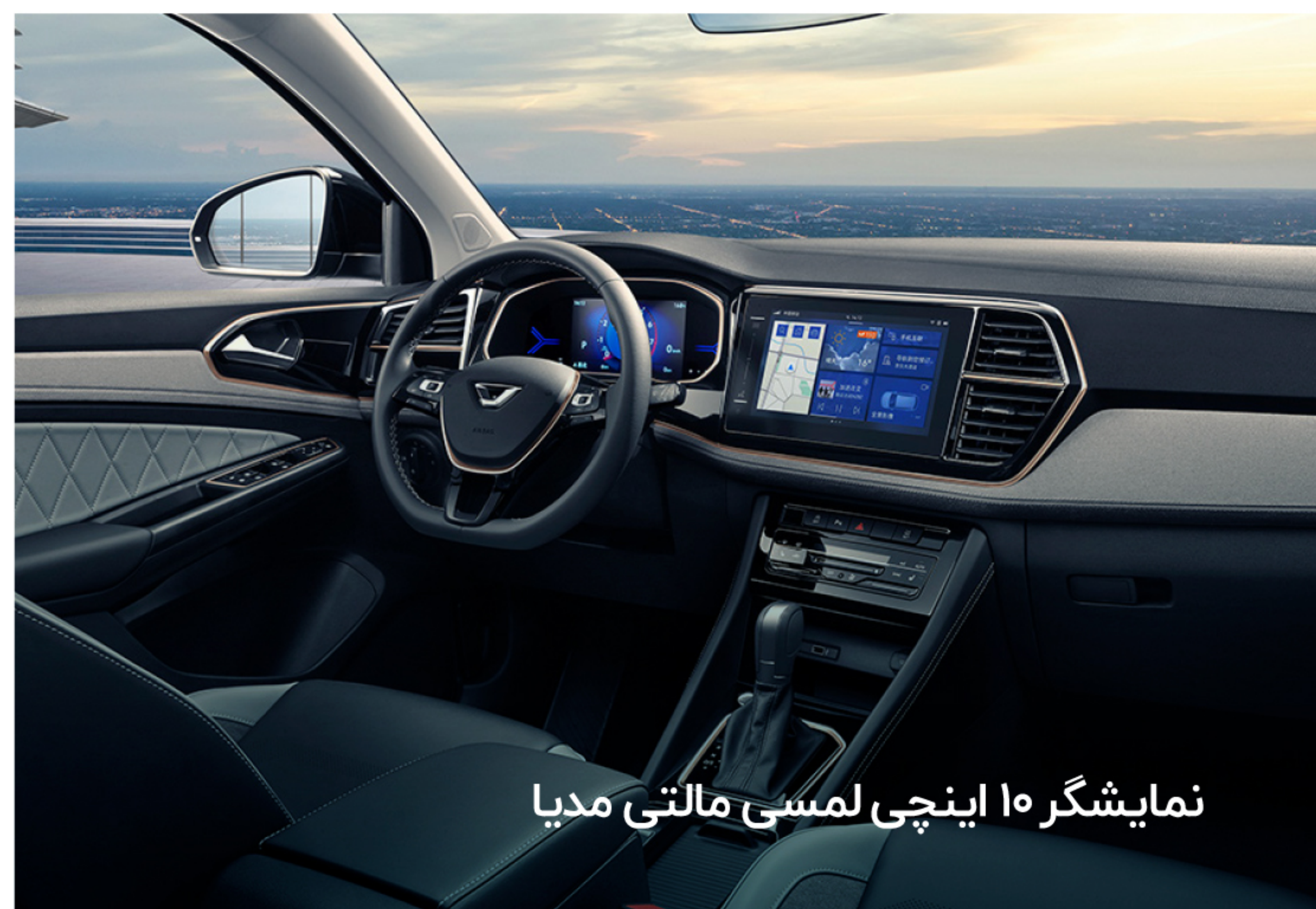
نمایشگر ۱۰ اینچی لمسی مالتی مدیا