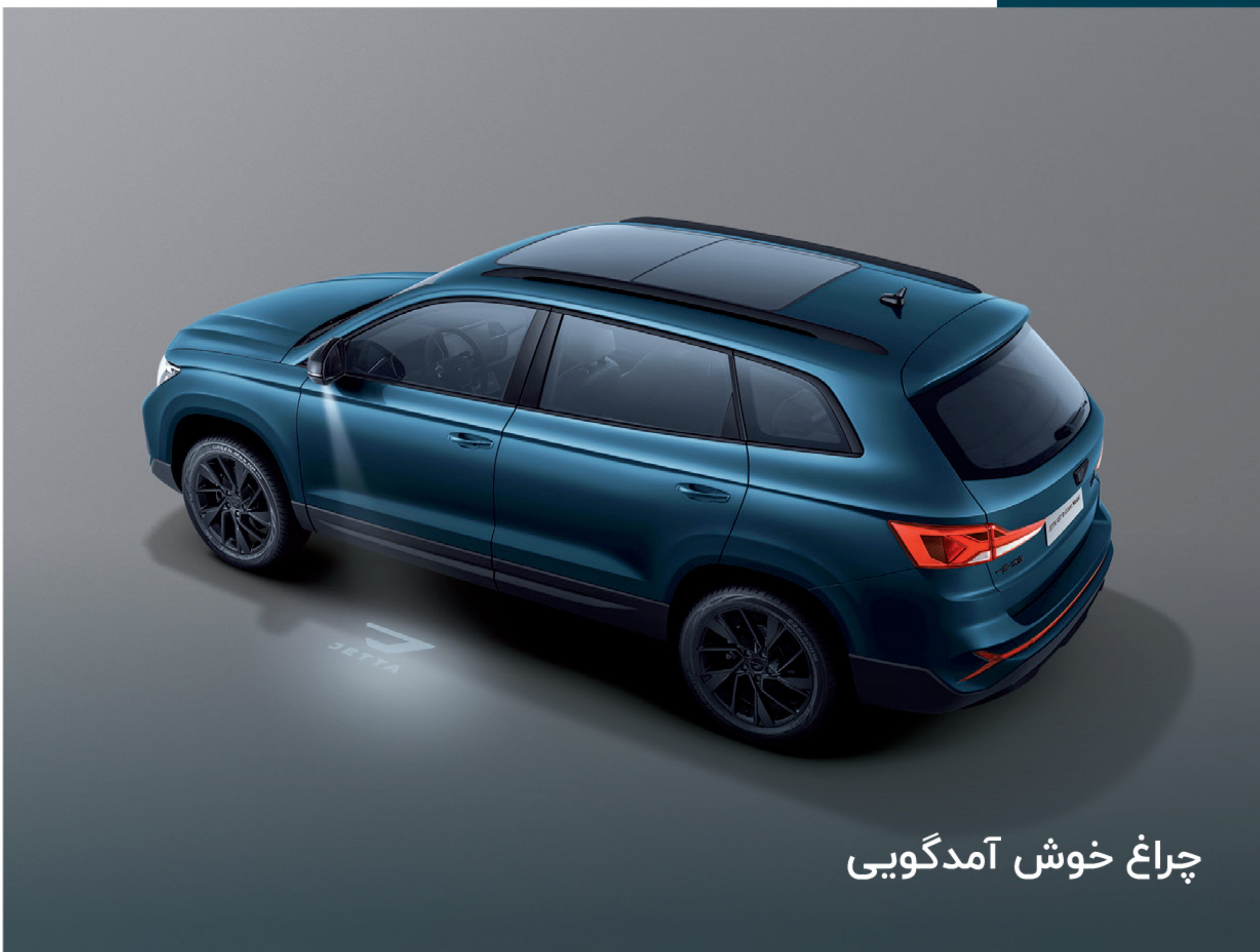
چراغ خوش آمدگویی