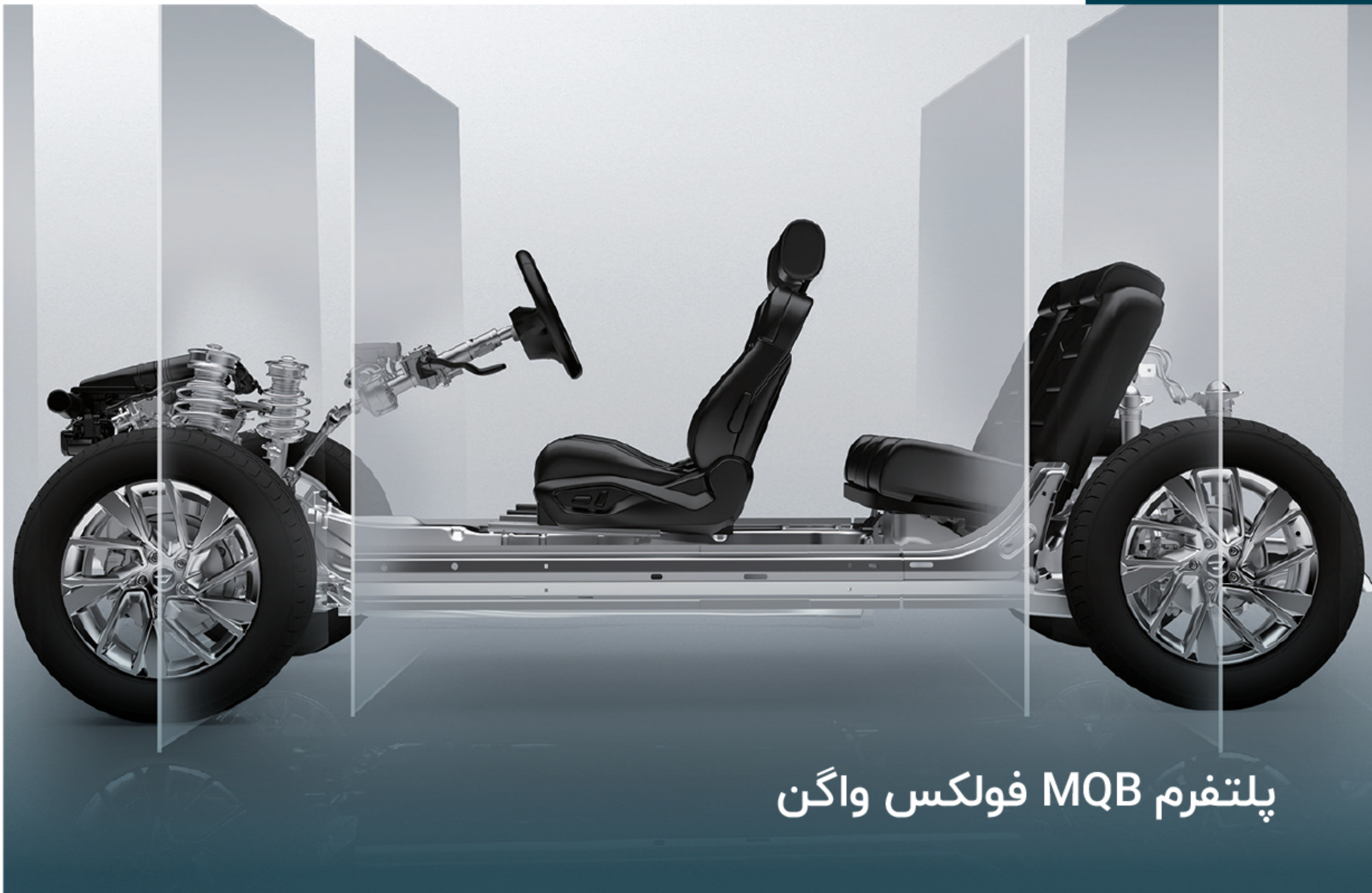
پلتفرم MQB فولکس واگن