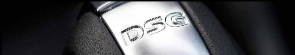
گیربکس اتوماتیک ( DSG )