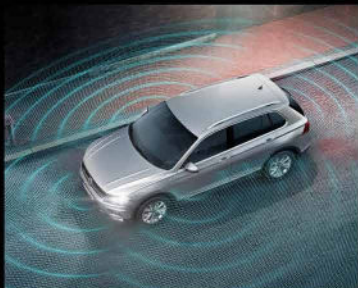
دوربین ۳۶۰ درجه