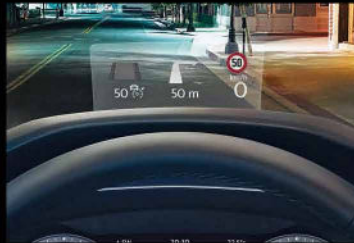
Head up display