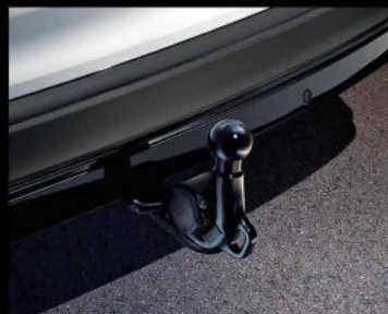
Trailer Hitch با قابلیت تا شونددگی به صورت الکتریکی