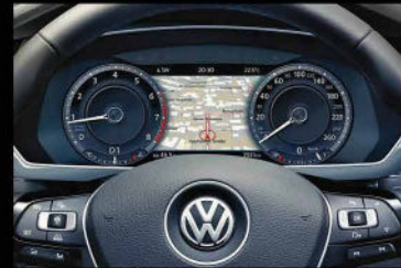
صفحه کیلومتر دیجیتال پیشرفته