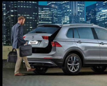
باز شدن درب صندوق عقب به صورت هوشمند