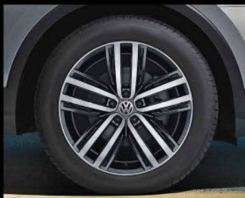
رینگ ۱۹ اینچی آلومینیومی